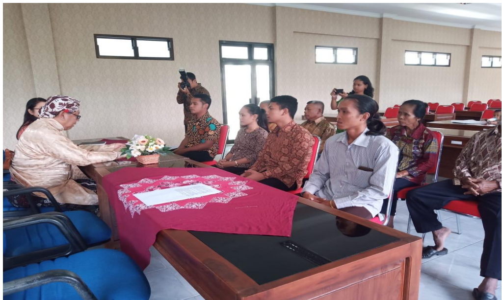
Gambar 2.2 Pelayanan pencatatan perkawinan di Dinas