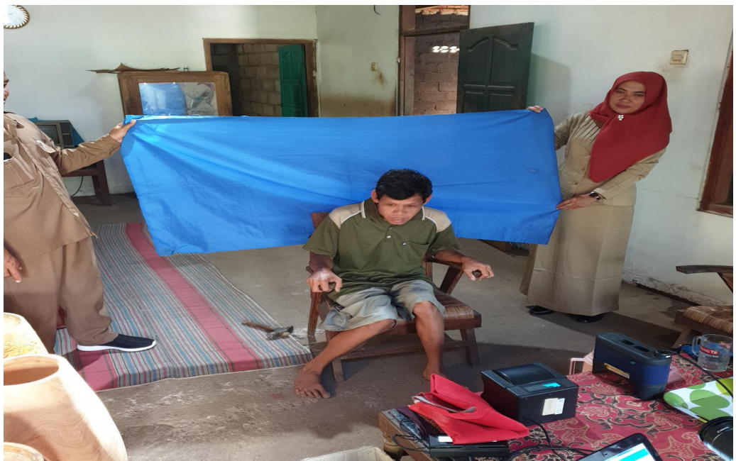
Gambar 2.6 Perekaman Jemput Bola Pemula , Manula dan Difabel