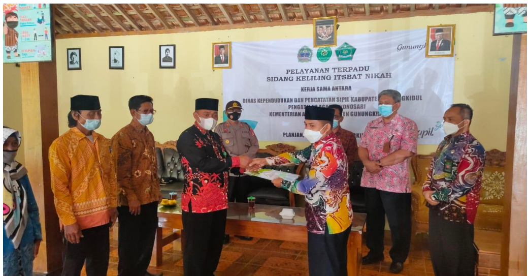
Gambar 2.4 Pelayanan Sidang Isbat