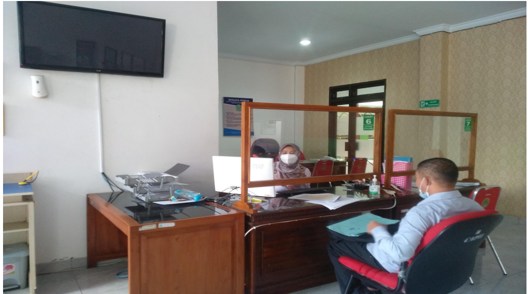
Gambar 2.1 Pelayanan Administrasi Kependudukan di Dinas Kependudukan dan Pencatatan Sipil

dokumentasi kegiatan pelayanan adminduk serta implementasi inovasi pelayanan dapat disampaikan sebagai berikut :