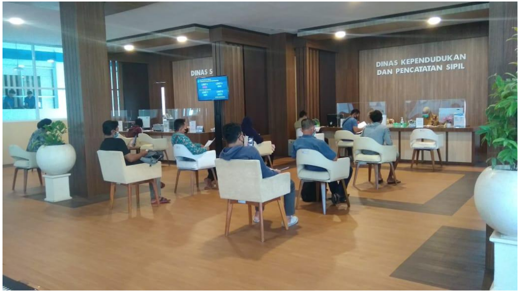
Gambar 2.3 Pelayanan di Mall Pelayanan Publik pada Terminal Dhaksinarga