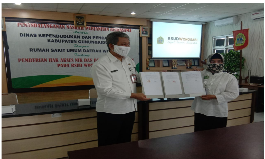
Gambar 2.5 Penandatanganan Perjanjian Kerjasama dengan RSUD Wonosari